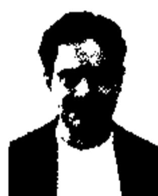
IVÁN CEPEDA CASTRO