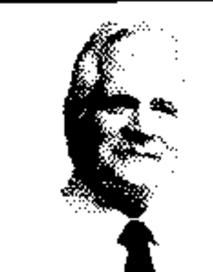
MIGUEL URIBE LONDOÑO