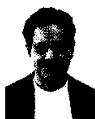
IVÁN CEPEDA CASTRO